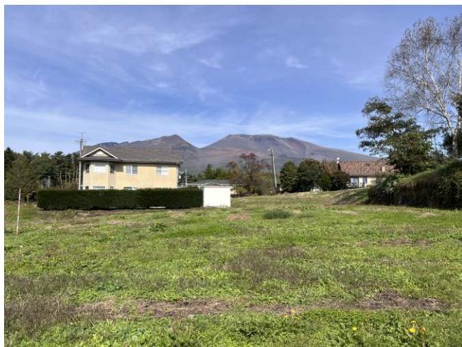
雄大な浅間山を望む日照良好の土地